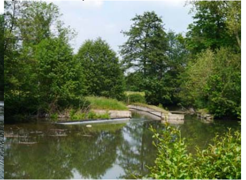
Vue sur les deux bras forcés de l'Iton

Pour la zone bleu foncé dans le périmètre de 500m