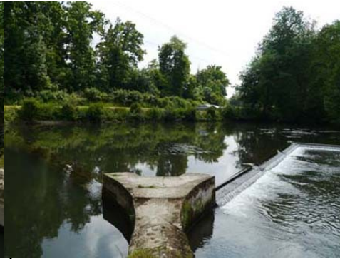
Épi ou bec donnant son nom au Becquet