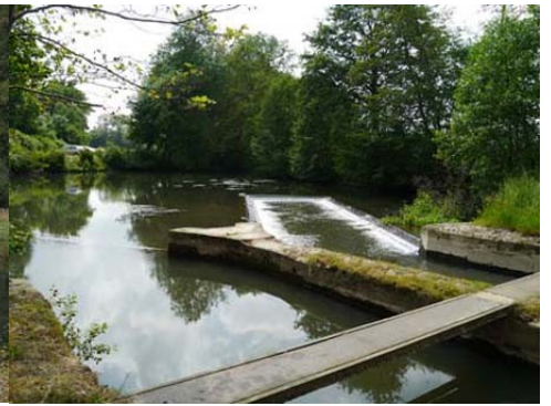
Système de répartition des débits