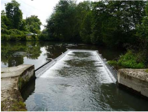
Bassin et bras forcé de l'Iton