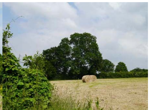
Abords immédiats et environnement